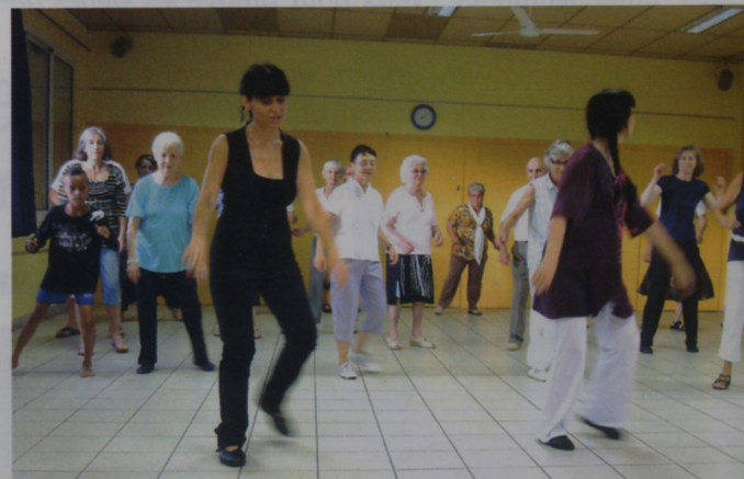
Ambiance et danse autochtone

Quand la danse se décline sur des rythmes nouveaux, les adeptes se font nombreux et la convivialité reste au rendez-vous !