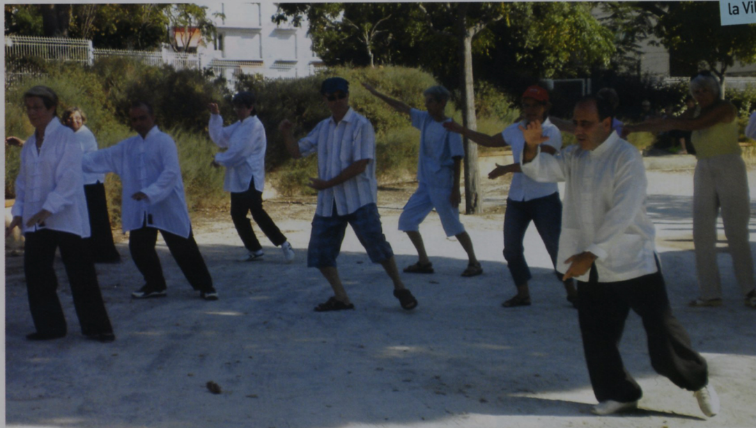
De nombreux d'habitants se sont laissés séduire par cet a

Réunion publique arrivée du haut débit sur le secteur Est à la mairie de quartier Est à 18h30